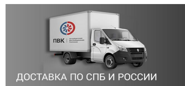
ДОСТАВКА ПО СПБ И РОССИИ

Завод производит более 150.000 наименований изделий. Информацию уточняйте в отделе продаж: 8 (812) 318-44-15 или отправляйте заявки по эл.почте: office@pvkspb.ru