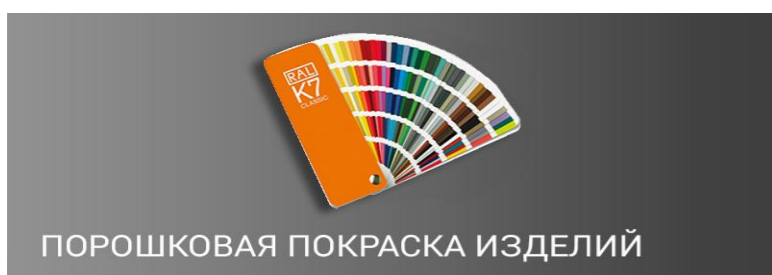
ПОРОШКОВАЯ ПОКРАСКА ИЗДЕЛИЙ