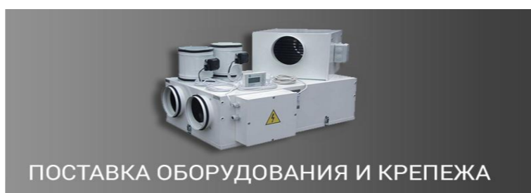
ПОСТАВКА ОБОРУДОВАНИЯ И КРЕПЕЖА