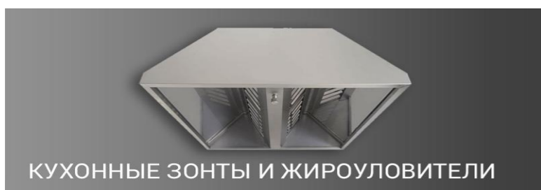
КУХОННЫЕ ЗОНТЫ И ЖИРОУЛОВИТЕЛИ