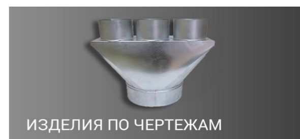
ИЗДЕЛИЯ ПО ЧЕРТЕЖАМ